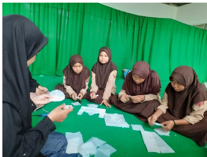
Gambar 5. Pemotongan Plastik Menjadi Lingkaran Bergelombang