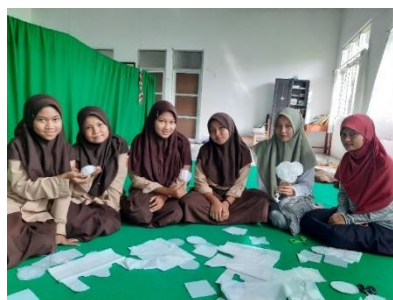
Gambar 7. Pembentukan Bunga dari Rangkaian Kelopak