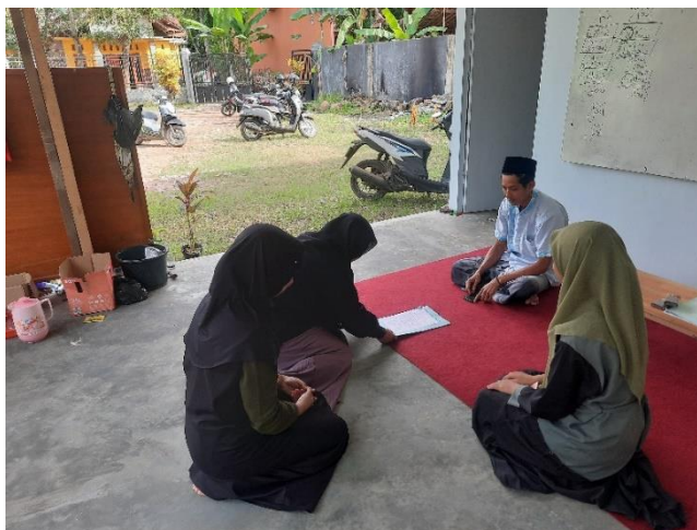
Gambar 1. Permohonan Perizinan

dikreasikan. Selain itu, terdapat alat dan bahan lain sebagai penunjang dan pelengkap dalam pembuatan buket bunga, di antaranya lem tembak, kawat bekas, plastik chelophonee, pita, kain tebal, serta gunting.