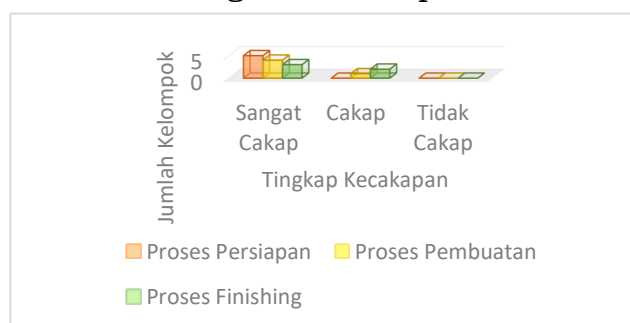
Gambar 11. Grafik Tingkat Kecakapan Peserta