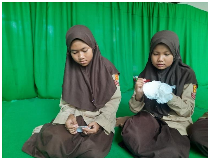
Gambar 8. Penyusunan Bentuk Buket Bunga