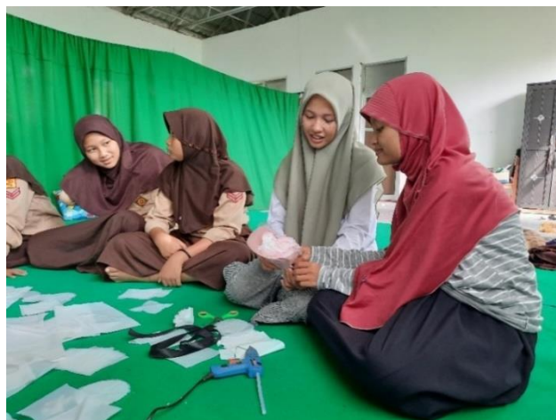
Gambar 9. Finishing Pembentukan Buket Bunga