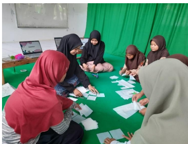
Gambar 4. Pemotongan Plastik Menjadi Persegi