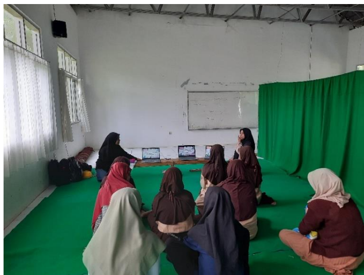
Gambar 2. Pembukaan Kegiatan