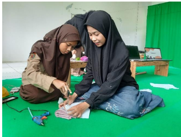
Gambar 6. Penyusunan Bentuk Kelopak Bunga