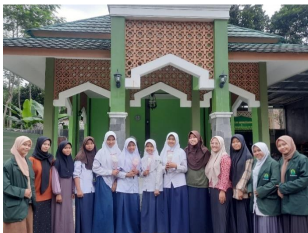
Gambar 12. Hasil Pelatihan Pembuatan Buket Bunga

Setelah dilakukan pelatihan pembuatan buket bunga dari bahan daur ulang, peserta telah bisa membuat buket bunga secara mandiri. Dari 10 santri putri yang dibagi menjadi 5 kelompok, yang mampu membuat buket bunga secara kreatif ada 4 kelompok atau 8 anak. Kendala yang dialami oleh 1 kelompok lainnya yaitu sulitnya membuat rangkaian kelopak bunga karena butuh kreativitas yang lebih pada saat membuatnya.