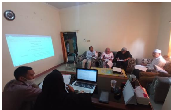
Gambar 2. Konsultasi dengan Tim Bale Mediasi Nusa Tenggara Barat