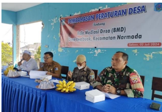
Gambar 3. Pembahasan Peraturan Desa tentang Bale Mediasi Desa