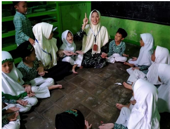
Gambar 4: Dokumentasi pembelajaran lagu Bahasa Arab

Dalam pengajaran lagu bahasa Arab, tim pengabdian menyanyikan setiap bait lagu sebanyak lima kali atau lebih, sambil menggunakan gerakan untuk membantu pemahaman. Setelah itu, anak-anak TK Muslimat NU Nawa Kartika XIX diminta mengikuti dan mengulanginya berkali-kali hingga lagu tersebut melekat dalam ingatan mereka. Proses ini terus dilakukan hingga seluruh bait lagu selesai.