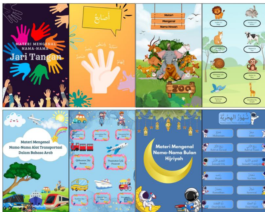
Gambar 3: Materi dalam Buku Ghina' al-'Arabiy Lil-Athfal

Buku Ghina' al-'Arabiy Lil-Athfal terdiri dari halaman sampul dan isinya ada enam lagu Bahasa arab. Setiap halaman berisi lirik lagu bertema sehari-hari, seperti nama benda, hari, dan hewan. Di akhir buku, terdapat barcode yang bisa dipindai untuk mendengarkan lagu sesuai lirik. Metode ini membuat belajar lebih interaktif, menyenangkan, dan membantu anak-anak memahami bahasa Arab dengan mudah. Berikut materi dalam Buku Ghina' al-'Arabiy Lil-Athfal: