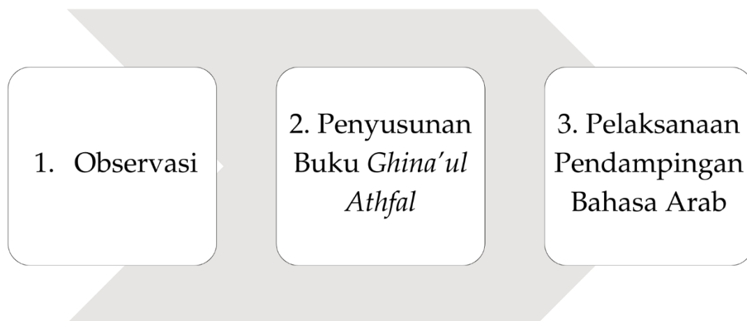
Gambar 1: Langkah-langkah Pendampingan Pembelajaran Bahasa Arab.

Langkah terakhir adalah pelaksanaan pendampingan bagi guru TK dalam mengajarkan bahasa Arab. Dalam tahap ini, peserta pengabdian mendemonstrasikan cara mengajar bahasa Arab menggunakan lagu-lagu yang terdapat dalam buku Ghina' al-'Arabiy Lil-Athfal. Guru TK diberikan kesempatan untuk mengamati langsung metode ini, dengan harapan mereka dapat mengaplikasikannya dalam proses pembelajaran agar anak-anak lebih antusias dan mudah memahami materi.