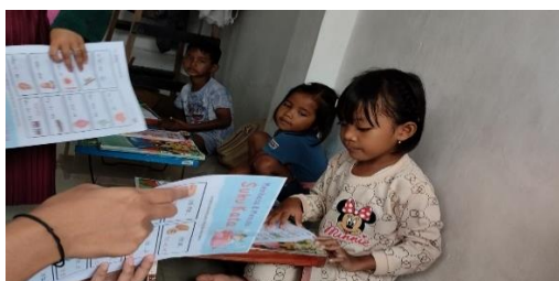
Gambar 1. Pembagian Media dan Bahan Ajar kepada Peserta Belajar

Kegiatan pelatihan membaca menggunakan metode fonik untuk melatih kemampuan membaca bagi anak usia dini diselenggarakan pada hari minggu, 25 Juni 2023 di desa Segeran Kidul blok mundu gang mawar. Penulis dibantu pengajar telah mempersiapkan media dan bahan ajar sebagai materi pelatihan. Materi mengenal bentuk dan bunyi suku kata ditentukan berdasarkan kemampuan yang telah dimiliki peserta dan sehingga kegiatan pelatihan menjadi lebih bermakna. Gambar 1 berikut merupakan persiapan kegiatan pelatihan dengan membagikan media dan bahan ajar.