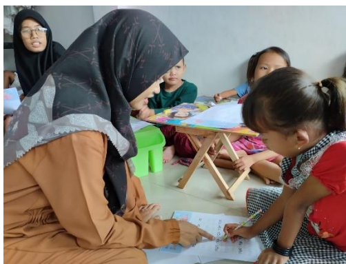
Gambar 2. Proses Mengenalkan Bunyi dan Huruf Suku Kata yang Terdiri dari Tiga Huruf

Penulis beserta pengajar berbagi peran dalam memberikan pelatihan yang dibagi menjadi 3 kelompok. Kelompok peserta yang belum bisa membaca dan menulis, kelompok yang belum lancar membaca dan menulis, serta kelompok yang sudah bisa membaca dan menulis. Dalam gambar 2 berikut ini, peserta yang sedang dilatih telah mampu membaca suku kata yang terdiri dari dua huruf. Penulis mengenalkan bunyi dan bentuk huruf dari suku kata yang terdiri dari tiga huruf.