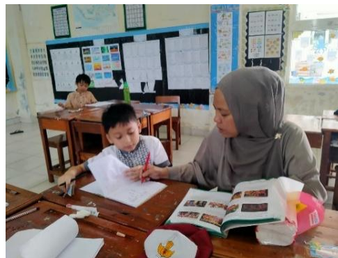
Gambar 3. Guru membimbing murid yang tidak fokus belajar

Penelitian ini menunjukkan bahwa keberhasilan pembentukan karakter disiplin belajar tidak hanya bergantung pada kemampuan guru menyampaikan materi, tetapi juga pada kemampuan guru menjalankan berbagai peran secara konsisten. Temuan penelitian ini melengkapi penelitian sebelumnya yang lebih banyak membahas peran guru dalam pembelajaran formal. Dalam penelitian ini, kegiatan belajar tambahan terbukti menjadi ruang yang efektif bagi guru untuk membentuk disiplin belajar murid melalui pembiasaan, keteladanan, pengawasan, motivasi, dan evaluasi yang dilakukan secara berkelanjutan.