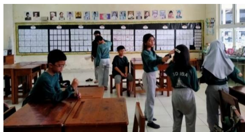
Gambar 5. Keterbatasan waktu pelaksanaan kegiatan karena murid membutuhkan waktu untuk beristirahat