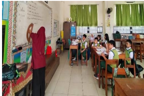
Gambar 2. Guru memberikan contoh disiplin belajar yang baik

pendapat Enung Nurhasanah dkk. yang menyatakan bahwa guru sebagai evaluator tidak hanya menilai hasil belajar, tetapi juga menilai proses dan sikap murid selama pembelajaran (Enung Nurhasanah dkk, 2024). Peneliti menganalisis bahwa evaluasi yang dilakukan secara langsung membuat murid lebih cepat memperbaiki kesalahan dan lebih bertanggung jawab terhadap tugas belajar mereka.