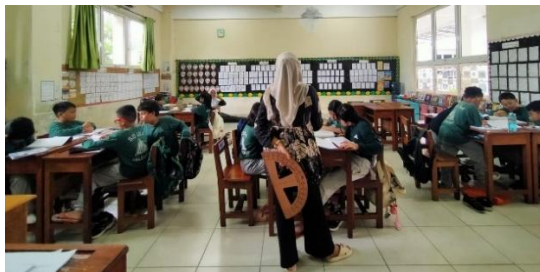
Gambar 1. Kegiatan Belajar Tambahan kelas III

Tahap evaluasi dilakukan melalui apersepsi, latihan soal, tanya jawab, dan koreksi tugas. Evaluasi tidak hanya digunakan untuk mengukur pemahaman materi, tetapi juga untuk memantau perkembangan disiplin belajar murid. Temuan ini menunjukkan bahwa kegiatan belajar tambahan di SD Yayasan IBA Palembang tidak hanya berfungsi sebagai penguatan akademik, tetapi juga sebagai sarana pembentukan karakter disiplin belajar secara berkelanjutan (Debi Sintia Latiki dkk, 2024).